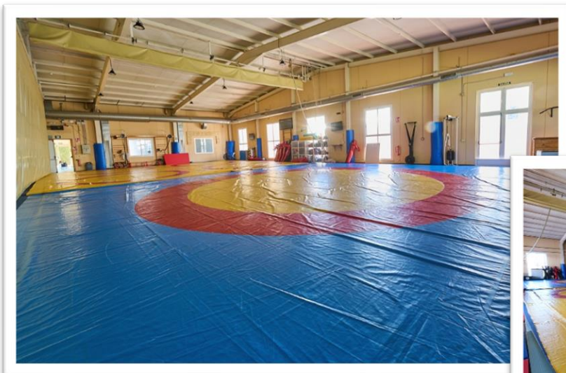
SALA DE COMBATE

Todos los medios materiales y humanos para sacar el máximo partido de las facultades de cada deportista.