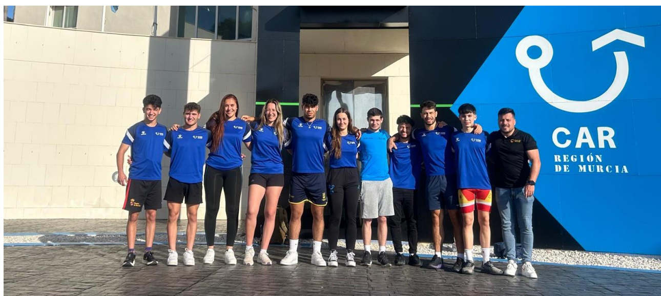
EQUIPO LUCHA CAR MURCIA 2023/2024

La concesión de becas para la residencia del CAR Región de Murcia tiene como finalidad, facilitar la especialización y mejora técnica de los deportistas desde sus inicios y durante las diversas etapas de tecnificación hasta el alto rendimiento y alto nivel, creando un clima de entrenamiento y convivencia entre deportistas de diferentes modalidades deportivas, fomentando la educación integral que favorezca su desarrollo personal y facilitando la mejora de su rendimiento deportivo con la finalidad de alcanzar el máximo nivel competitivo, dando la posibilidad de tener su lugar de residencia y estudios en un centros educativos cercanos como el IES Antonio Menarguez Costa.