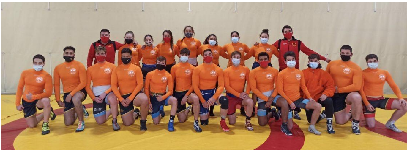
EQUIPO CAR 2020/2021

La concesión de becas para la residencia del CAR Infanta Cristina tiene por objeto facilitar el entrenamiento de los deportistas de máximo nivel dando la posibilidad de tener su lugar de residencia y estudios en un centro educativo cercano (IES ANTONIO MENARGUEZ COSTA).