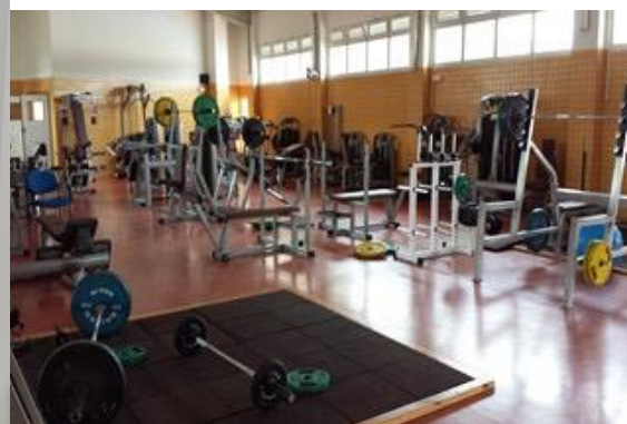
SALA DE MUSCULACION CAR DE MURCIA