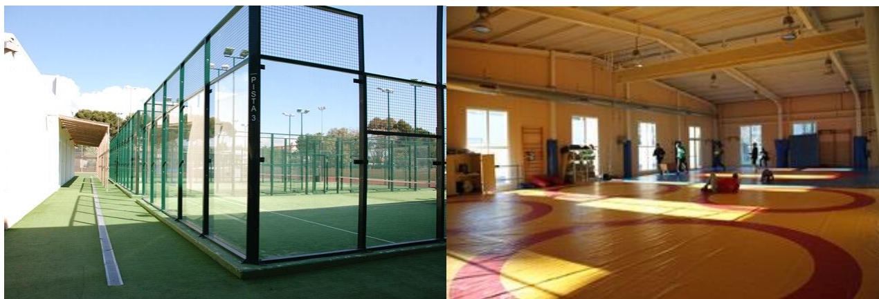
SALA DE COMBATE CAR DE MURCIA

Todos los medios materiales y humanos para sacar el máximo partido de las facultades de cada deportista.