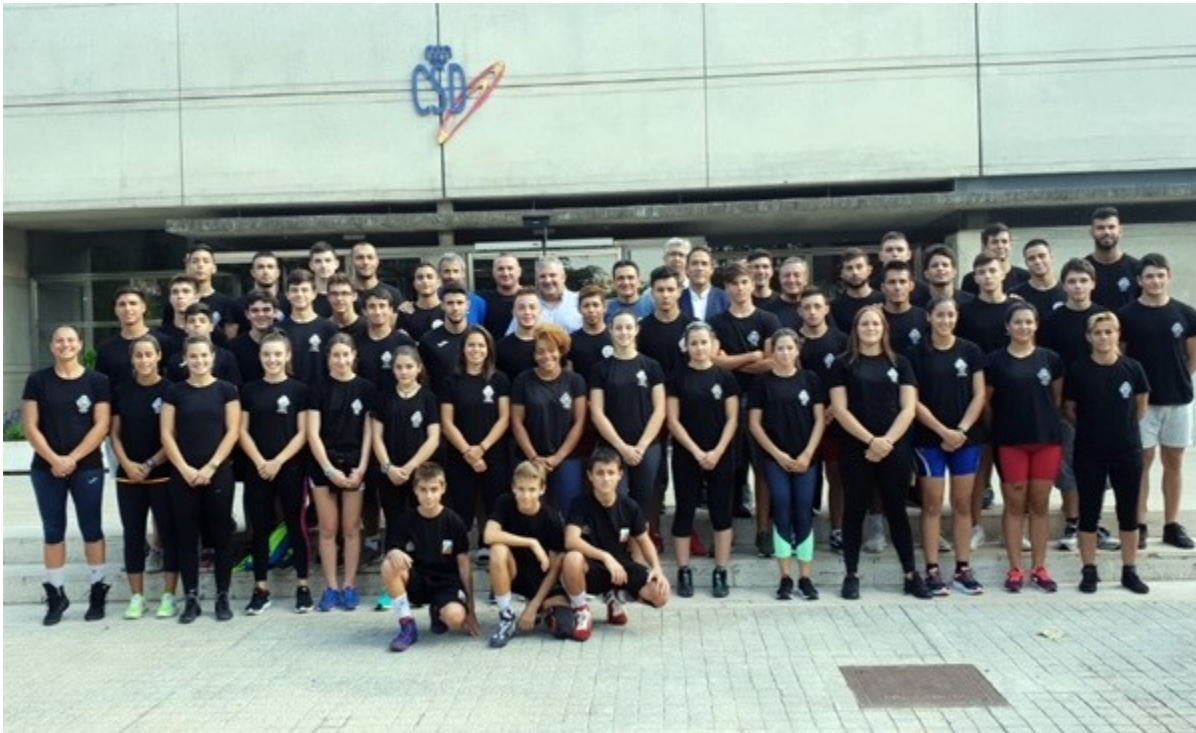
EQUIPO CAR 2018/2019

La concesión de becas para la residencia Joaquín Blume tiene por objeto facilitar el entrenamiento de los deportistas de máximo nivel dando la posibilidad de tener su lugar de residencia y estudios en el propio Centro de Alto rendimiento de Madrid.