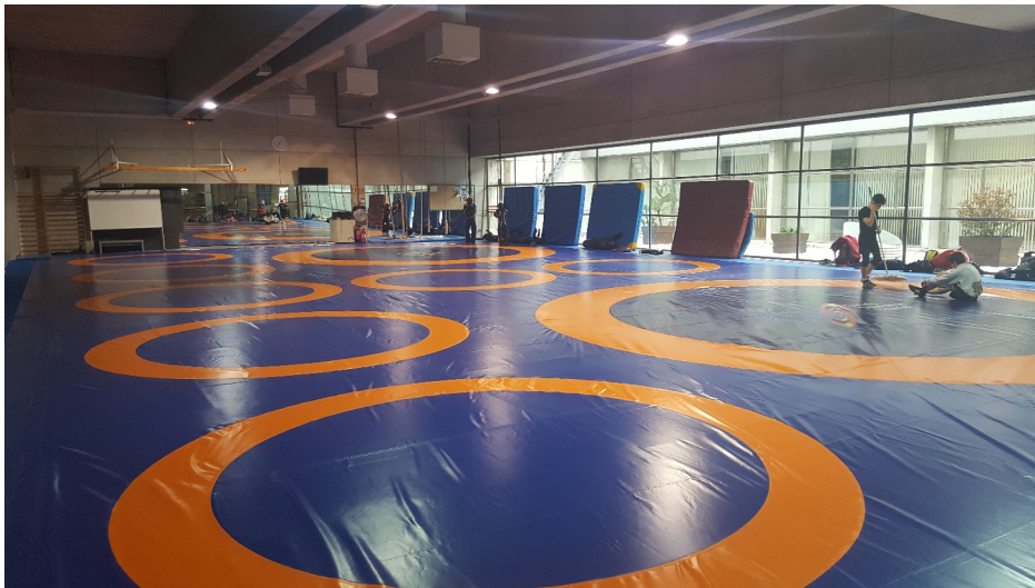
SALA DE COMBATE CAR DE MADRID

Todos los medios materiales y humanos para sacar el máximo partido de las facultades de cada deportista.